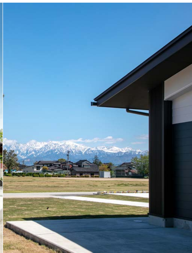
グラウンド越しに見える雄大な立山連峰の眺め