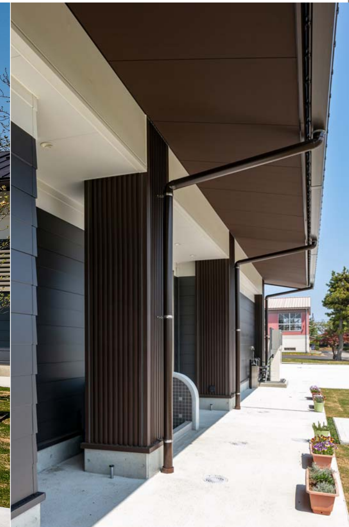
雨風や雪の吹込みを防ぐ深い軒の出