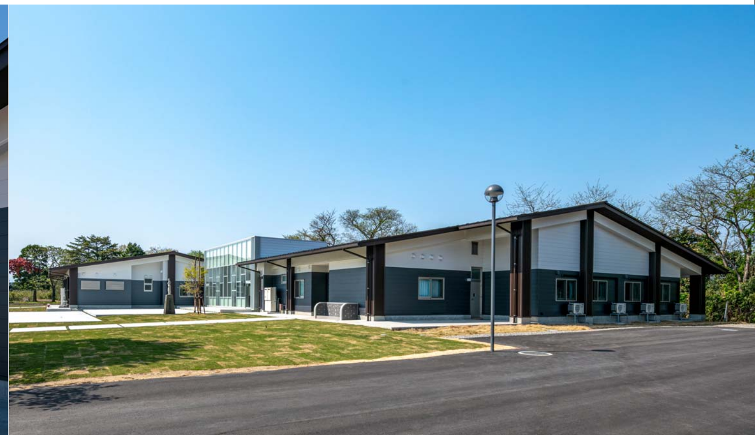
シンプルな切妻の大屋根形状の男女寮とガラス張りキューブ形状のランチルーム