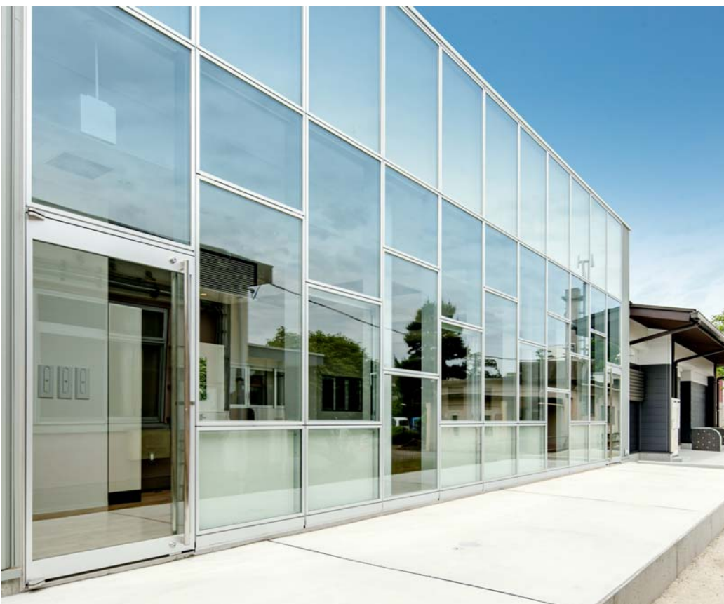
開放的なランチルーム・ガラス張りのファサード