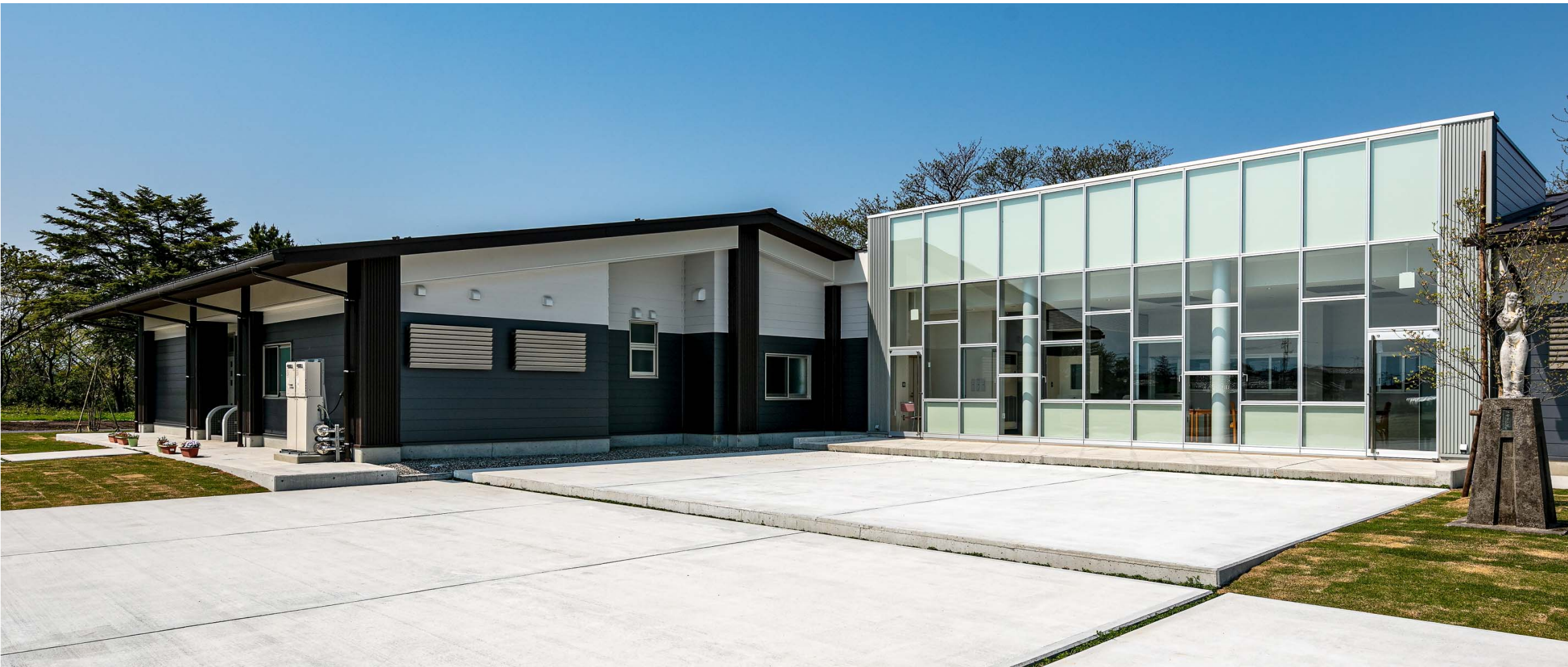
イベントにも利用できるランチルーム前の広場